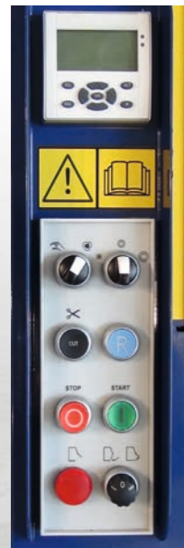
TABLEAU DE COMMANDE AVEC AFFICHEUR BEDIENFELD MIT ANZEIGE